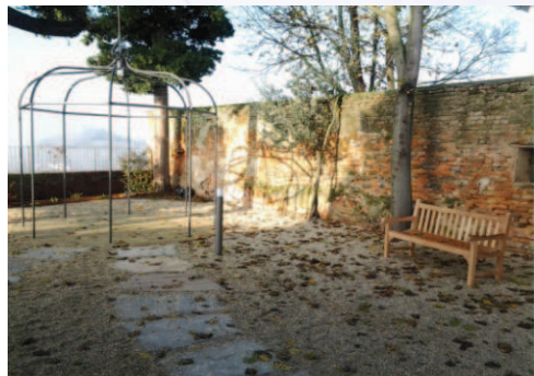
Gazebo per eventi/manifestazioni