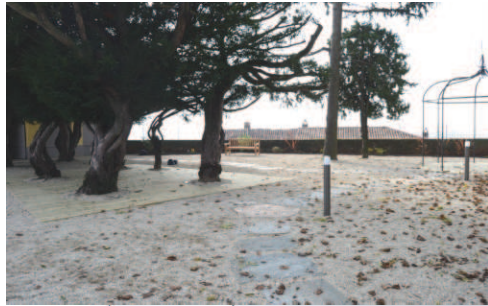
Camminamenti in pietra di Luserna annegati nel ghiaietto