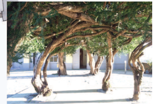
Tavolato in legno con illuminazione scenografica dei tassi

L'architettura del paesaggio è la disciplina che si occupa dell'analisi, della progettazione e della gestione degli spazi aperti, dal giardino al parco al paesaggio. L'AIAPP rappresenta dal 1950 i professionisti attivi nel campo del Paesaggio, è membro di IFLA (International Federation of Landscape Architects) e di EFLA (European Federation of Landscape Architecture) e raggruppa oggi circa 550 Soci impegnati a tutelare, conservare e migliorare la qualità paesaggistica del nostro paese.