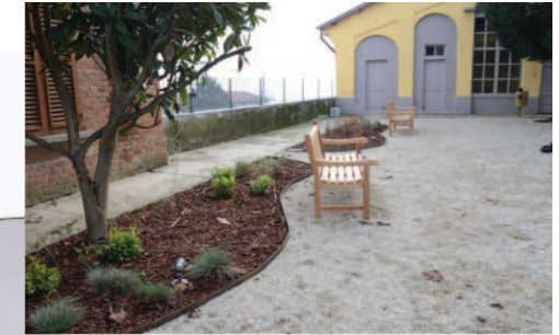
Bordure di perenni e cespugli