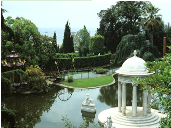
Villa Durazzo Pallavicini, Genova. Sede ufficiale dell'AIAPP